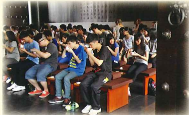
活動有動有靜，茶禪就是教我們學會放下，感受自在。

在暑假期間，大埔慈山寺舉辦夏令營活動，活動豐富多樣：包括寺院定向、宗教體驗、營火晚會、茶禪及向觀音聖像供水等。透過三日兩夜的活動，提高同學對慈山寺及佛教儀軌的認識。一行十多位同學反應理想，他們認為活動有趣，別開生面，是一個多采多姿的佛教夏令營活動。