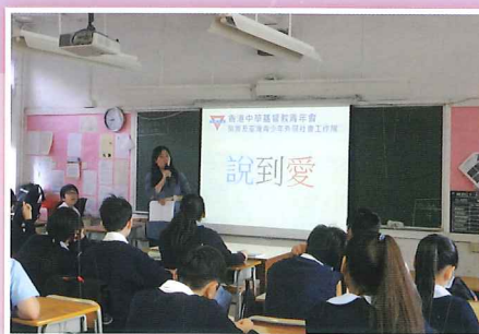
與性教育組合辦的「性教育工作坊」活動