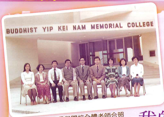
梁校長與開校全體老師合照