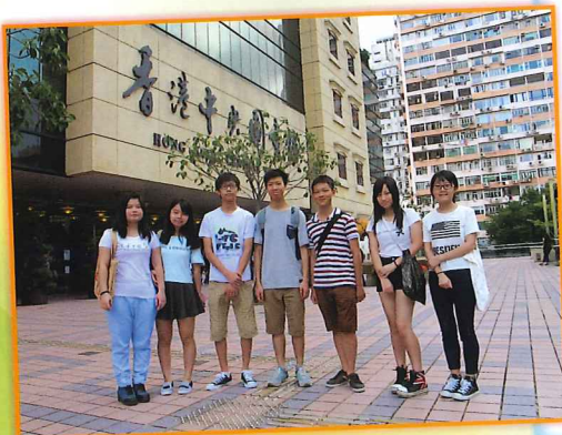
觀賞電影前，先到香港中央圖書館走走