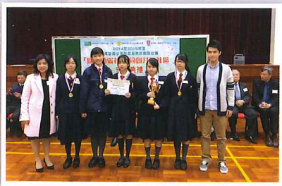
獲頒最佳報告書獎