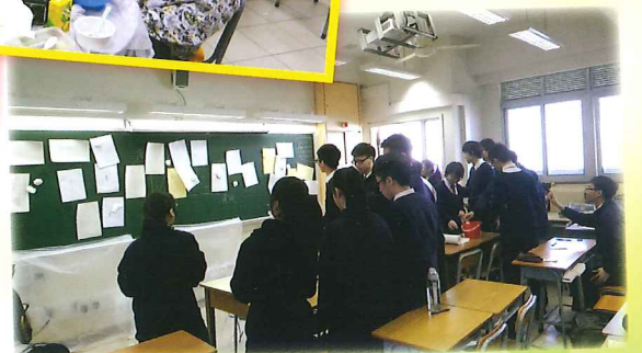
中六級處理壓力工作坊