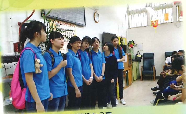
長者服務活動分享