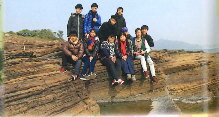
地理科野外考察 — 東平洲地質及地貌考察