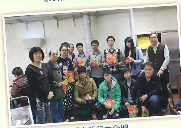
獲獎幸運兒大合照