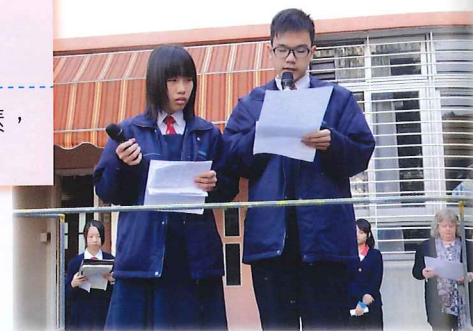
早會分享得獎作品