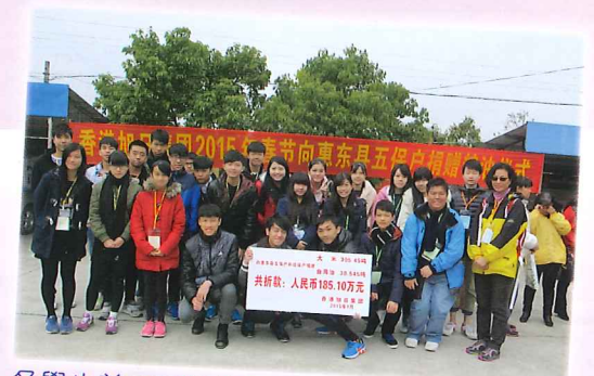
各學生義工蓄勢待發，到特困戶派送米糧

在此特別感謝慈輝佛教基金會對是次活動的支持，加上隨隊老師用心籌劃，期望日後能有更多不同的活動，讓年青人透過不同的體驗灌溉慈悲的種子，學習關心社會，養成布施助人的習慣，在人生路上隨着不同的因緣實踐慈悲的精神。