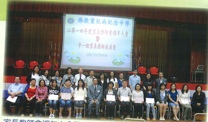
家長教師會週年大會暨 中一級家長教師座談會