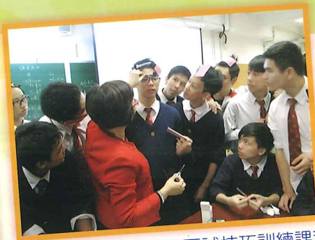
「待人有禮」-儀容及面試技巧訓練課程