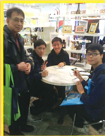
參觀教育及職業博覽2015