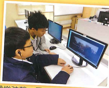
「電樂弦聲」電子音樂創作體驗計劃