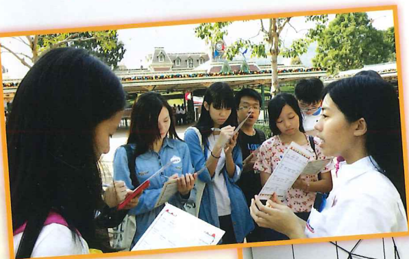
旅遊與款待科聯課活動 — 迪士尼青少年計劃： 迪士尼工作體驗坊