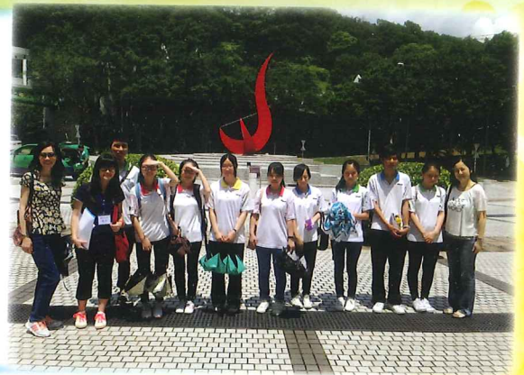
師生於香港科技大學前拍攝留影