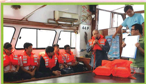
大澳漁業及海洋資源考察