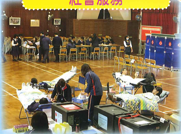
香港紅十字會捐血日