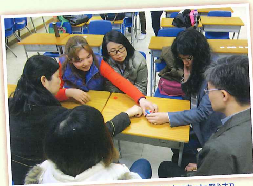
家長教師委員從活動中建立默契