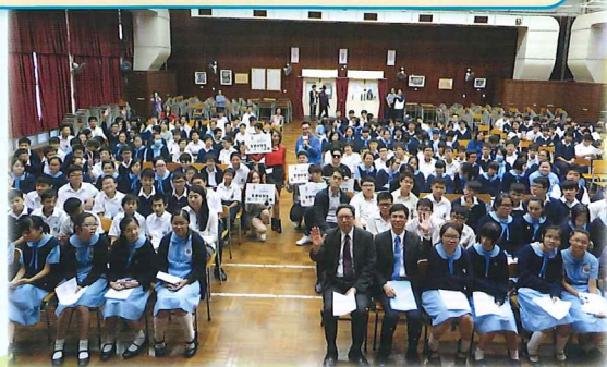
「全港中學生寫·作·樂計劃」—2014/15學校巡遊