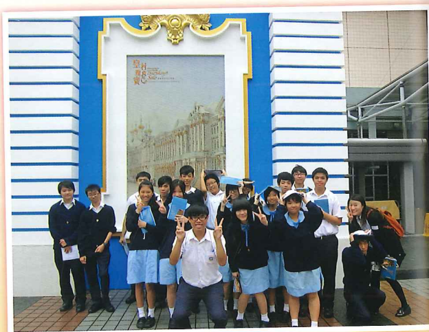
通識教育科聯課活動—參觀皇村瑰寶俄羅斯宮廷文物展