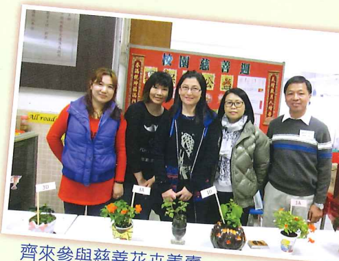
齊來參與慈善花卉義賣