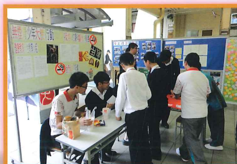
無煙大使活動： 吸煙的禍害與影響