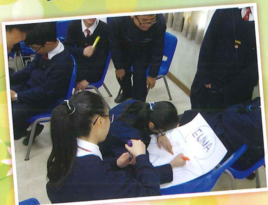
品德教育講座- 他們仨