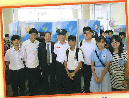
多元智能躍進計劃嘉許禮