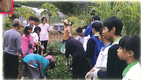
北區長者探訪 - 同學們幫忙掘蕃薯