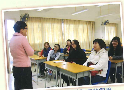
家長教師委員用心聆聽社工的解說