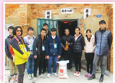
五保戶獲米糧後感恩萬分