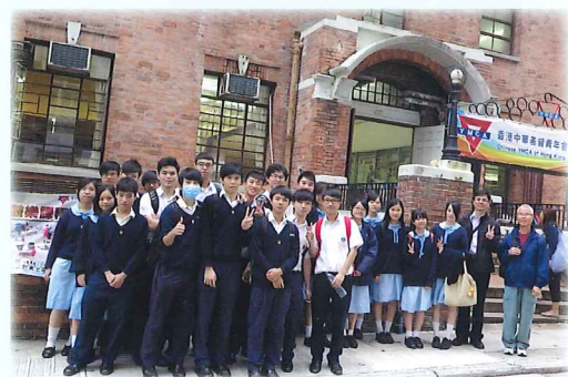
同學參加「中西區文物徑上環線」導賞團時留影