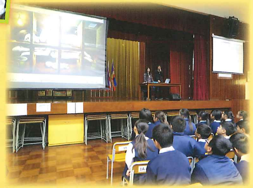
本土藝術家淋漓瀉儂到校分享藝術創作經驗