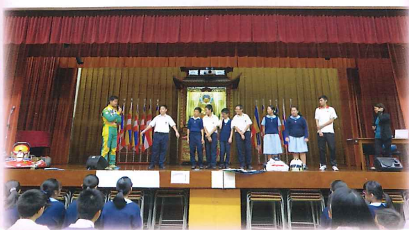
週會講座 「人生方程式」