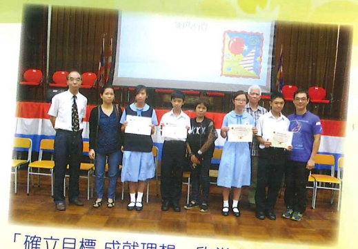
「確立目標 成就理想」欣賞卡獎勵計劃