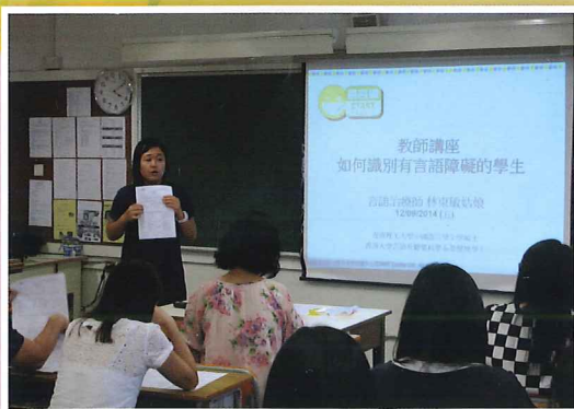
教師專業訓練——如何識別有言語治療障礙的學生