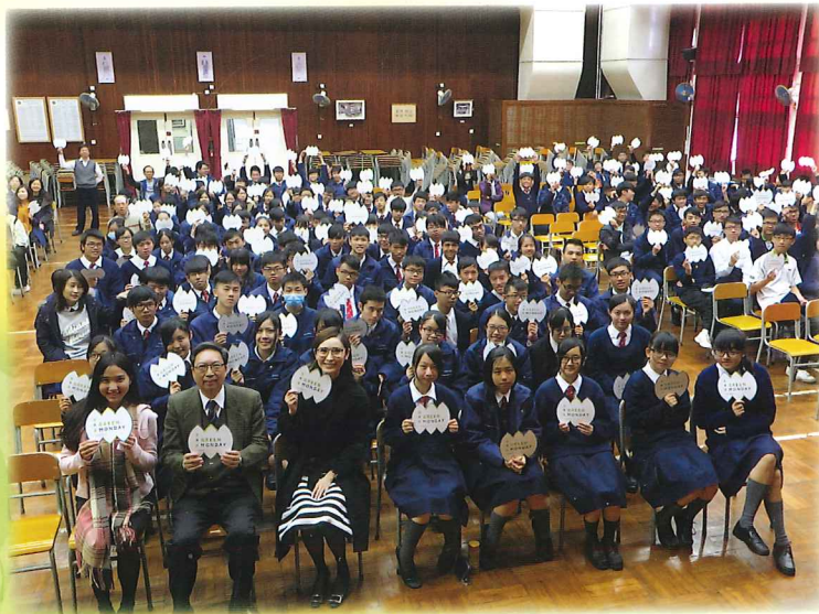
Green Monday 講座