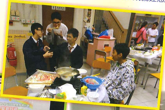
「校園宿一宵」 一暢談一樂也