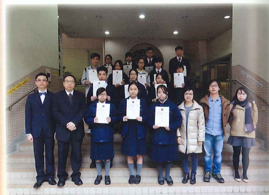
徵文比賽得獎同學與校長及老師合照