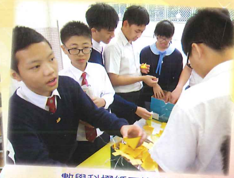
數學科摺紙王比賽