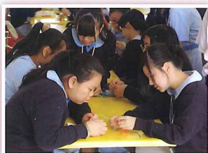
高年級同學在教授吉祥結的編織方法，讓同學認識中國傳統藝術。

中文週已於2014年11月10日至11月14日圓滿完成。配合本年度學校關注事項「以禮待人」，今年中文週以「禮」為主題。不同類型的活動攤位吸引了各級同學參加。活動內容如下：