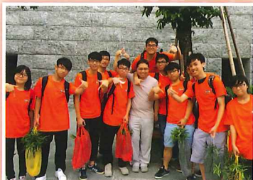
三日兩夜的活動令同學滿載而歸