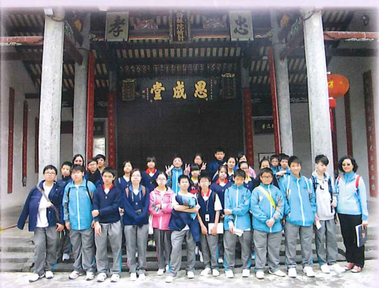
「中一級圍村考察活動」 —同學於清樂鄧公祠內合照