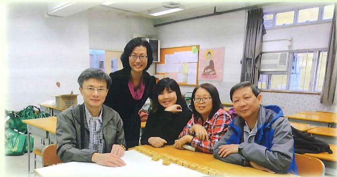
家長協助準備敬老活動的「利是」