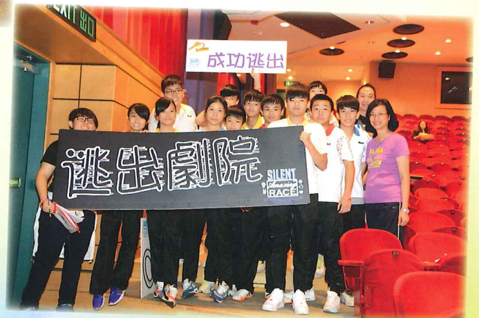
完成挑戰，逃出劇院