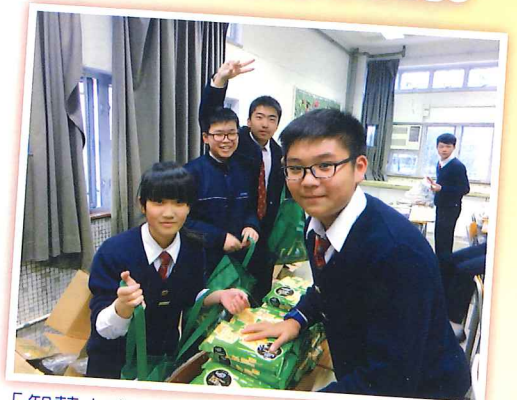
「智慧人生 和樂自在」講座及敬老活動