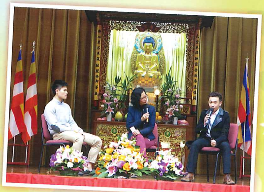
校友分享講座-「敢於夢想，實踐夢想」