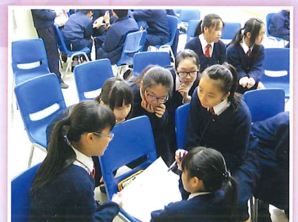
中二級周會「他們仨」—學生正進行分組討論