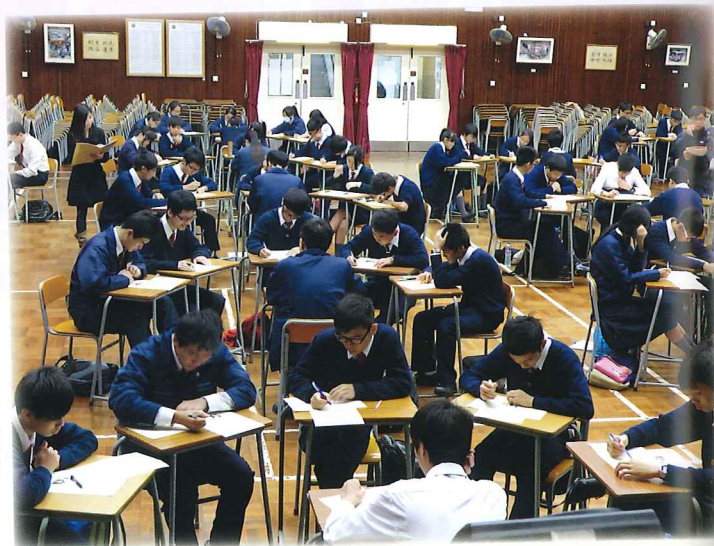
中國語文科聯課活動—口語溝通練習