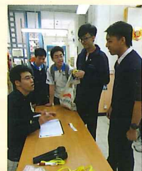
同學上門探訪後，向長者中心社工匯報

是項活動於2015年1月24日進行，本校共有45位同學參加，他們分別就讀中二至中六級，在老師及社工指導下，初中同學由高中同學帶領，探訪佛教正行長者鄰舍中心的獨居長者。同學分組上門探訪，與長者閒話家常，並送贈福袋，聊表心意，同學的關切問候，讓獨居長者感受到絲絲暖意。