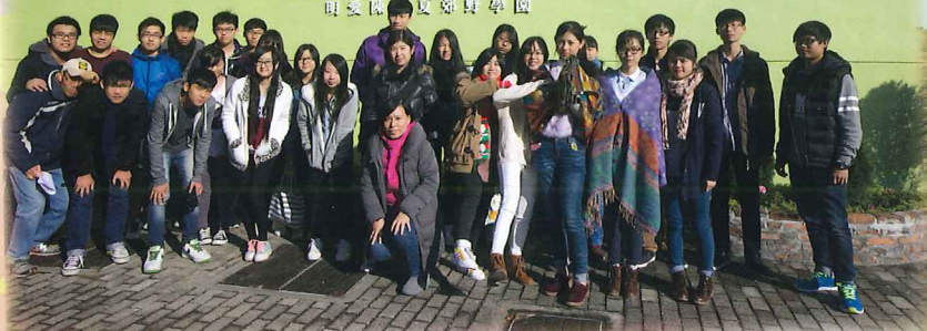
物理科和地理科跨科活動 — 長洲天文地理教育營