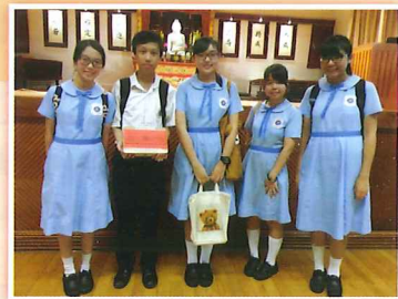
本校同學獲得最佳攤位設計獎

是項活動於去年七月份舉行，本校共有六名同學參加。當日參加同學齊集佛教孔仙洲紀念中學，進行長者服務，對象為長者服務中心約200名公公婆婆。學生首先許下服務承諾，接受專業社工訓練。同學須設計遊戲攤位，學習服務長者。同學樂見長者玩得投入，自己也倍覺開懷。最後同學都明白到敬老的意義，並實踐了自利利他的精神。本校同學更奪得最佳攤位設計獎。