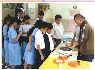
蔡老師和同學合作烹調湯圓，大受同學歡迎