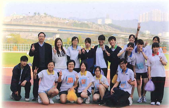
朋輩調解員在陸運會宣揚和平訊息

「朋輩調解計劃」學員於2014年11月中旬舉行簡單而隆重的交接儀式，由校長委任新一屆的調解員，學員秉承朋輩調解精神，將和諧的訊息帶到校園每一個角落。朋輩調解員接受一連串的調解訓練後，隨即舉行「中一工作坊」。當天，他們分組到各中一課室，以遊戲的形式讓中一同學了解自己面對衝突時的情緒反應，以及讓他們學習以有效的方法處理憤怒的情緒，使他們明白當遇上衝突時不只能找老師幫忙，還可以聯絡朋輩調解員協助。