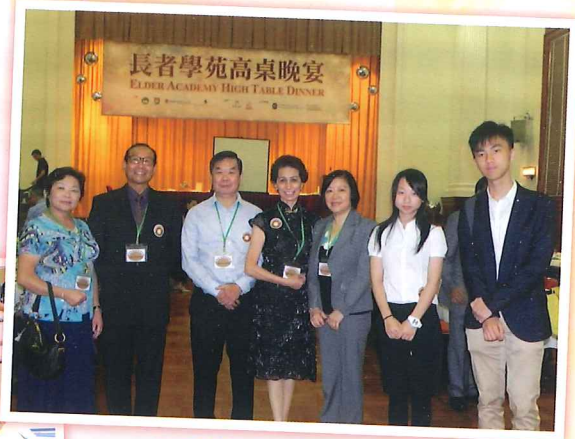
參與晚宴同學與長者合照