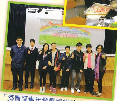
「葵青區青年發展網絡計劃」分享會