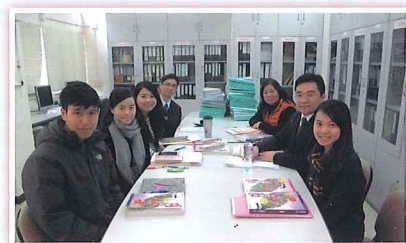
共同備課節開會情況