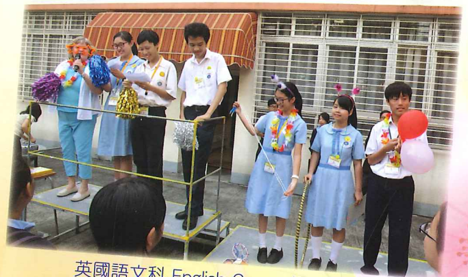
英國語文科 English Corner 活動宣傳