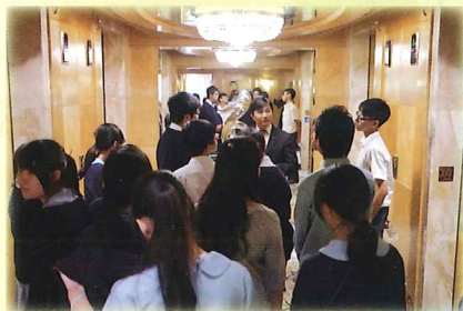
Door to the Future-參觀酒店

為了讓同學增加自我認識、發掘潛能及了解職場，小童群益會手作仔同盟與學生支援組於2014年10月8日至11月19日合辦「Door to the Future 夢想起動計劃」。14位中三級同學參與了一系列生涯規劃的活動，包括：職業性向測試、小組訓練、參觀天比高創作伙伴、富豪香港酒店以及甜品製作等。同學在活動中認真投入，透過活動有深刻的體會及反省，從而更認識自己，發掘自己的優點及興趣，同時亦為自己將來的出路訂下目標。