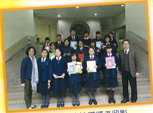
中英文硬筆書法獲獎者留影