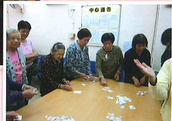
玩懷舊遊戲拍公仔紙