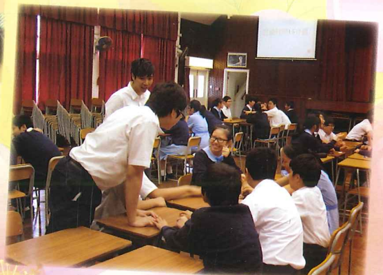
中國語文科聯課活動