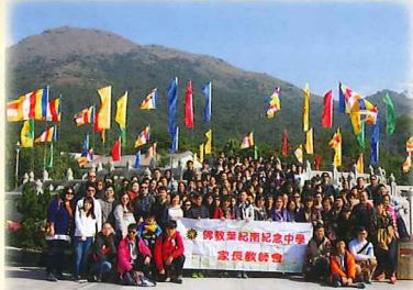
參加師生於地壇前先來大合照

上述活動共有145人參加，他們先在東涌乘搭纜車，接著自由參觀昂坪市集及天壇大佛，午膳享用寶蓮寺美味齋菜及進行大抽獎，過後乘旅遊巴士往大澳，體會漁村風光，更可順道購買手信。是次參觀寶蓮寺，一行人更獲准參觀新落成的萬佛寶殿，可謂福緣深厚。是日親子旅遊，參加者一家人聚首一堂，參加師生於地壇前先來大合照