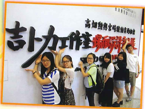
吉卜力工作室場面設計手稿展

為提高新來港學童對英語學習的興趣及及早適應社區生活，本組於本年度為同學舉辦了不同的活動，如：「光·影·人生體悟計劃」電影欣賞及寫作活動、「英文應試班暨西貢戶外活動一天遊」、參觀科技大學、香港文化博物館及香港中央圖書館等，同學寓學習於娛樂，積極參與。