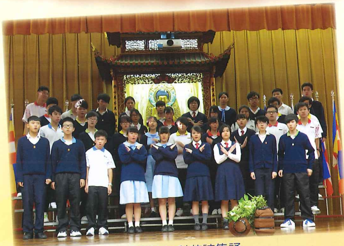
英國語文科英詩集誦

在現今社會，要找到待人真誠有禮的真不容易啊！但就是因為不容易，所以更是彌足珍貴。我也相信只有待人以誠，別人才會真心真意對待自己，否則徒具禮的形式，而沒有禮的本質，這種「禮」便不要也罷了。