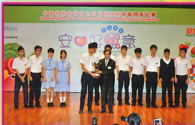
在「中學校際食物安全及營養標籤常識問答比賽」中榮獲全港季軍