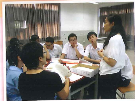
數學科與學校社工協作的「數學小老師」培訓課程

為使學生達到全人發展，新高中課程亦為學生提供不同的其他學習經歷機會，並以學生學習概覽展示有關經歷，而其中的學生自述部分則協助同學反思。